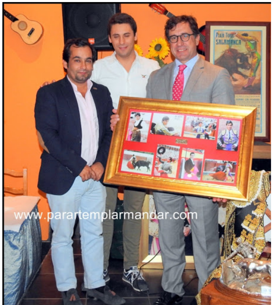
O homenageado com o cabo fundador dos Forcados de Alenc