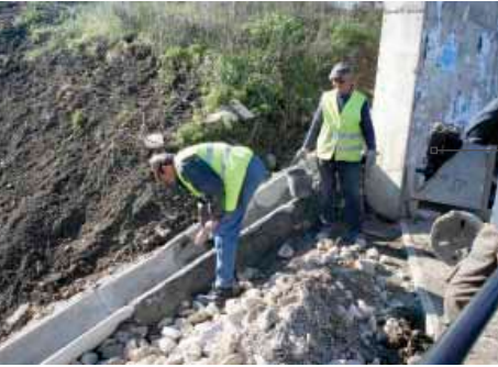
Colocação de drenagens pluviais e protecções para peões na ponte sobre a Ribeira das Salemas, em Arruda dos Vinhos.