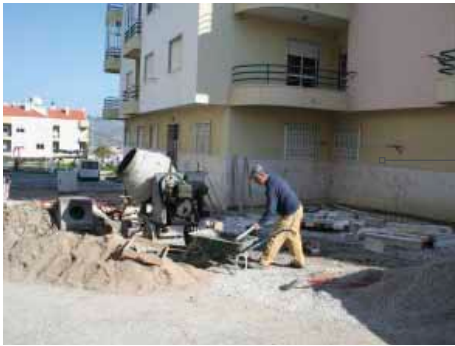
Construção de estacionamento e passeios pedonais na Urbanização Cerrado e Fontainhas, Arruda dos Vinhos, com apoio da Junta de Freguesia.