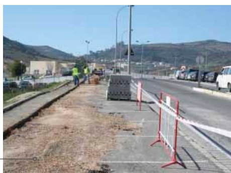
Construção de passeio pedonal na Av. Eng.º Adriano Brito da Conceição.