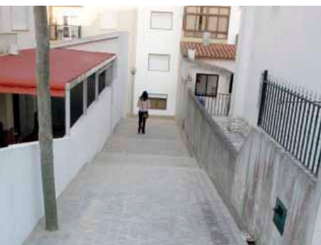
Acesso de tardoz para a Rua Manuel Policarpo Martins pela Av. D. Afonso Henriques, em Arruda dos Vinhos em conjunto com a Junta de Freguesia.