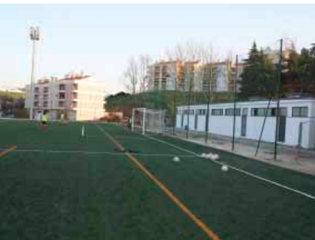
Postes de iluminação, balneários e bancadas já instalados no Campo de Jogos Municipal, em Arruda dos Vinhos.