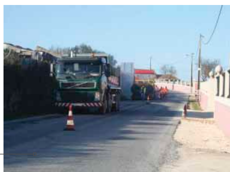
Reparação do pavimento na Estrada Nacional 268, junto a Galinhatos, Arruda dos Vinhos.