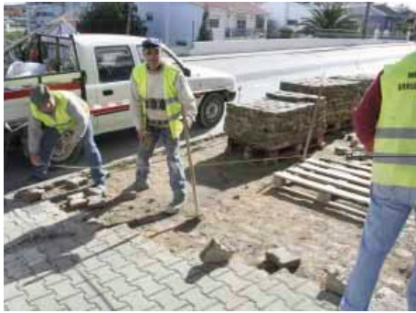
Construção de estacionamento na Av. D. Afonso Henriques, Arruda dos Vinhos, com apoio da Junta de Freguesia.