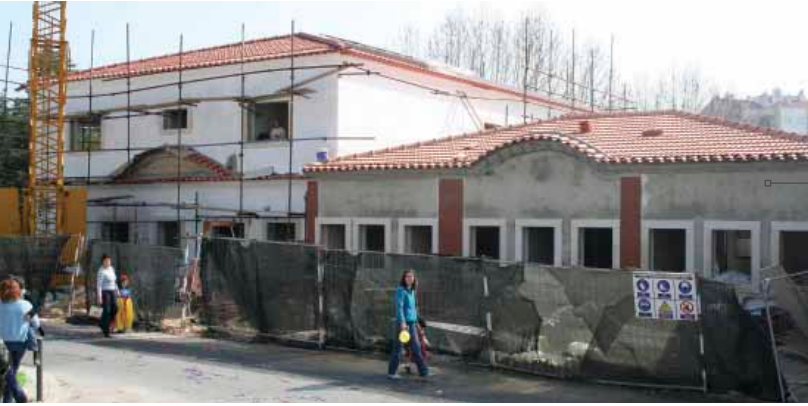
Construção do Quartel da GNR, fase final. Arruda dos Vinhos.