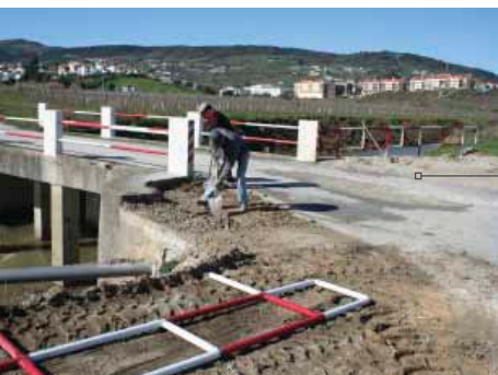
Reparação e colocação de protecção para peões na ponte sobre o Rio Grande da Pipa, aos Quatro Caminhos, Arruda dos Vinhos.